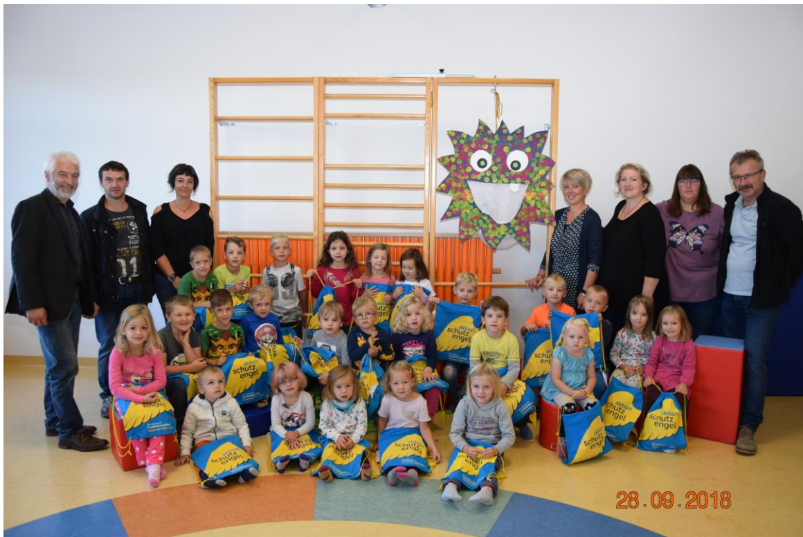
Kinder im Kindergarten Waldhausen

LH Johanna Mikl-Leitner und die Vertreter der Gemeinde wünschen allen Kindergarten- und Schulkindern einen unfallfreien Weg zum/vom Kindergarten und der Volksschule sowie ein schönes und erfolgreiches Kindergarten- und Schuljahr.